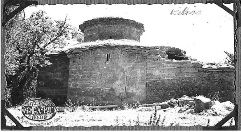
Halvori Vank Manastırı veya Aziz/Surp Garabed Manastırı, 1937 ve 1938 civarı 14

manastırda Hz. Ali'nin oğlu Hüseyin'in orta parmağının uç kısmının bulunduğu ve bu parmağın altı çeşit renkli, özel bir koruyucuyla –mumya gibi– korunduğunu ifade etmektedir. Bu parmak, manastırın Alevi Zaza/Kürtlerince de kutsal bir yer olarak görülmesini sağlamıştır. Rivayet, Surp Garabet Vank Manastırı'nın hem Alevi Zazalar/Kürtlerle Ermenilerin 'ortak ibadet ve tapınağı' olmasından hem de kilise keşişinin çok güvenilir olmasından dolayı Seyit Rıza'nın önemli evraklarını ve parasını keşişe emanet ettiğinden bahsetmektedir. Keşiş 1938 sırasında bu emanetlerin bir kısmını koruyabilmiştir, diğer kısmının ise hâlâ gömülü olduğu söylenmektedir (akt. Kalman, 1995: 68-69). Seyit Rıza'ya emanet edilen Halvori Surp Garabet Manastırı'nın tarihsel değerlere sahip kültürel varlıkları (Ermenice İnciller, haçlar ve başka eşyalar) Dersim Harekâtı sırasında ordunun bu manastıra müdahalesi sonucunda ele geçirilmiş ve aşağıdaki resimlerde de görüleceği üzere 7 Kasım 1937'de Ulus Gazetesi tarafından Seyit Rıza aleyhine "suç unsuru" ve "hokkabazlık hikâyesi" şeklinde haberleştirilmiştir.